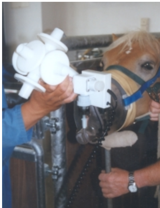
Abb. 2: Durchführung der Aerosolprovokation bei einem Pferd