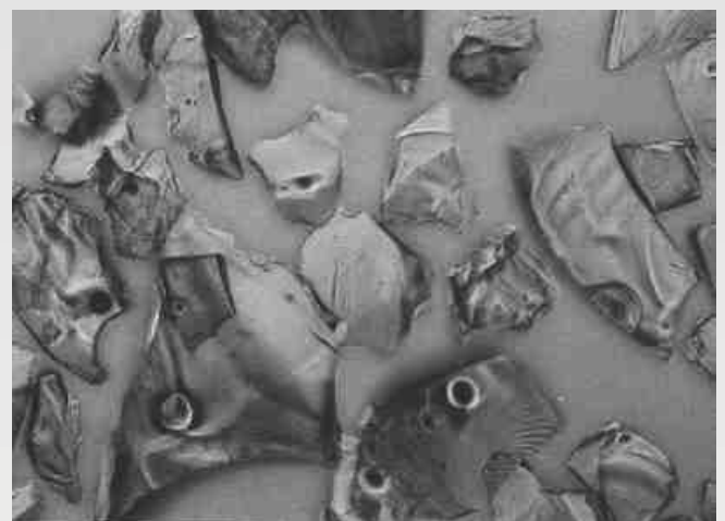
" Öl-Ex hart " nach der Reinigung